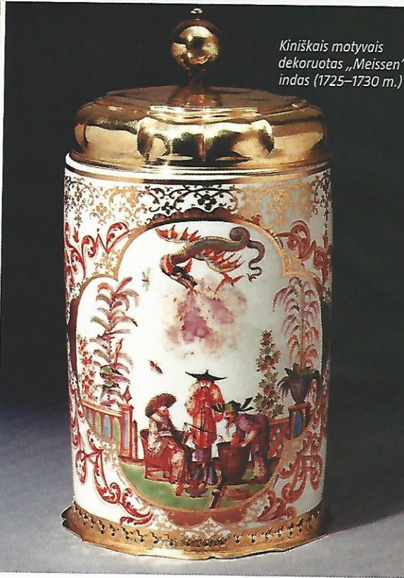
Kiniškais motyvais dekoruotas „Meissen“ indas (1725–1730 m.)