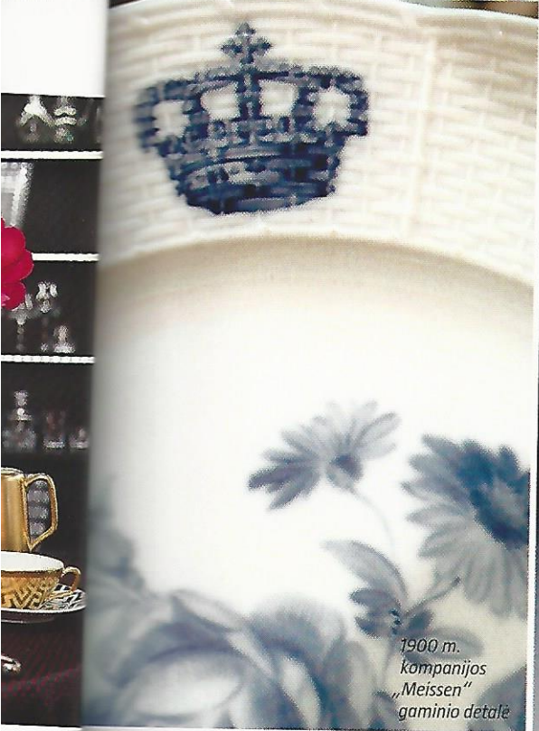
1900 m. kompanijos „Meissen“ gaminio detalė