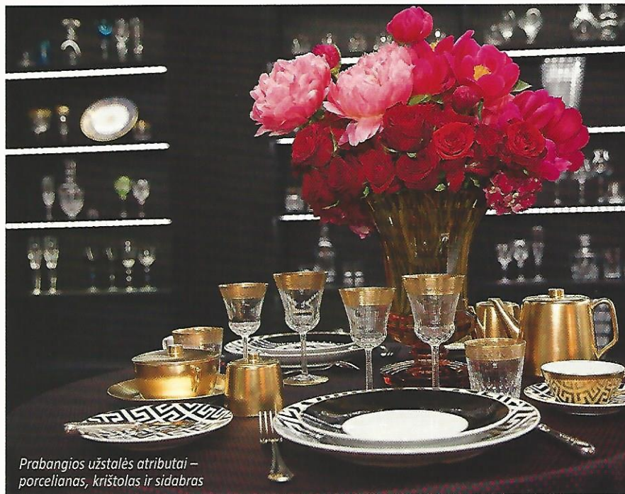
Prabangios užstalės atributai – porcelianas, krištolas ir sidabras

Bajorų buities tyrimų, pasak M. Daraškevičiaus, atlikta labai mažai, kur kas daugiau tyrinėtoms valstiečių buities tradicijoms, bet pasinaudojus įvairiais istoriniais ir ikonografiniais šaltiniais galima susidaryti gyvenimo dvaruose vaizdą. „Dvarus kartais per daug idealizuojame. Labai didelę prabangą sau galėjo leisti vos 1,3 proc. bajorų, didikų šeimų. Šiais laikais tai reikštų, kad toks turtuolis gali nusipirkti, tarkim, pirmos klasės bilietą lėktuvu, anais – šešia-kinę karietą, porceliano ir sidabro indų, meno kūrinių, gerų baldų. Tokie samdydavo ir daugybę tarnų, kiekvienam vaikui – po gubernantę griežtą vokiečių ar prancūzų, vėliau – anglę, skatino mokytis. Apie 30 proc. bajorų gyveno gerai, bet be didelės prabangos. Na, o smulkieji, šių buvo 70 procentų, dažnai ūkyje dirbdavo ir patys, tad mažai kuo skyrėsi nuo vals-